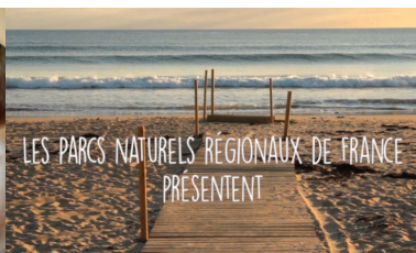
Clip Inventer Demain – Morbihan Fédération des Parcs naturels Fr