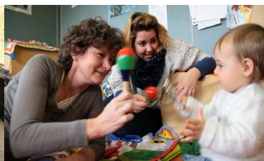
Film La Maison Verte de Niort