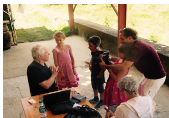
Film avec les enfants de Davejean (Aude)