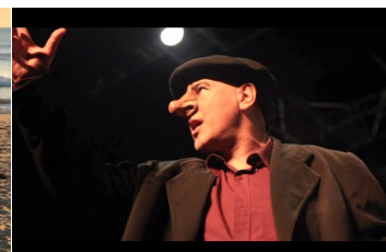
Cyrano de Bergerac – Chergui Théâtre 81